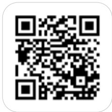
Dieser QR-Code führt direkt zum Entwurf des REP

Der neue Räumliche Entwicklungsplan soll uns mindestens für die nächsten zehn Jahre die Richtung vorgeben, in die wir in Ludesch weitergehen möchten. Einige von euch haben die Möglichkeit bereits genutzt, den REP-Entwurf online oder im DLZ Blumenegg genau zu studieren und Anregungen zu deponieren. Es ist wichtig, wenn sich die Menschen im Ort interessieren und sich einbringen, wenn es um die Zukunft ihres unmittelbaren Lebensumfelds geht. Die Begutachtungsfrist läuft noch bis zum 20. November. Wer sich also noch mit unserem Strategiepapier beschäftigen möchte, sollte sich in den nächsten Tagen dafür Zeit nehmen. Ich freue mich auf eure Anregungen.