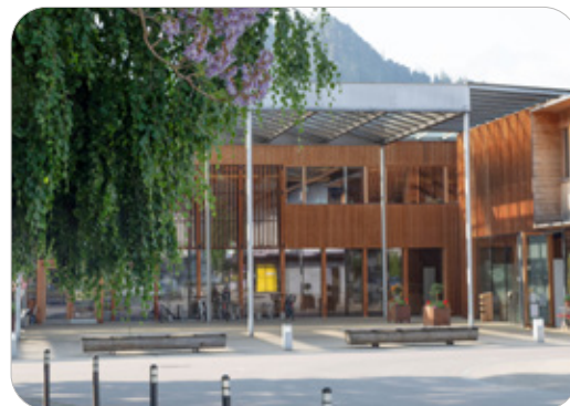
Das Café-Restaurant im Gemeindezentrum bietet vielfältige Möglichkeiten, sich gastronomisch zu verwirklichen.

„Wir suchen eine engagierte Betreiberin oder einen engagierten Betreiber, die beziehungsweise der diesen zentral gelegenen Gastronomiestandort mitten im Dorf mit Leben füllt“, erklärt Bürgermeisterin Alexandra Schalegg. Der modern eingerichtete Gastraum im Gemeindezentrum bietet auf einer Fläche von 139m 2 Platz für sechzig Gäste, inklusive Küche und Lager ist das Café-Restaurant 171m 2 groß. Außerdem steht eine große Terrasse zur Verfügung, die dank PV-Dach vor Regen geschützt ist. Im Gemeindezentrum befinden sich das Gemeindeamt, Vereinsräumlichkeiten sowie Büro- und Geschäftsräume, die verschiedenste Menschen anziehen. Die Säle können zur Bewirtung von Geburtstags-, Vereins- und Jubiläumsfeiern sowie Hochzeitsgesellschaften und Traueressen genutzt werden. Diese Räumlichkeiten und der angrenzende Dorfplatz werden zudem gerne für Seminare beziehungsweise Veranstaltungen gebucht, was zusätzliches Potenzial für die Bewirtung und gastronomische Umsätze bietet. Die Voraussetzungen, um einen lebendigen gastronomischen Treffpunkt im Herzen von Ludesch zu führen und zugleich von den vielfältigen Nutzungen im Gemeindezentrum zu profitieren, sind also gegeben. Wer Interesse hat, das Café-Restaurant zu übernehmen, möge sich direkt bei Bürgermeisterin Alexandra Schalegg melden (Tel: 05550/22 21-0, E-Mail: alexandra.schalegg@ludesch.at )