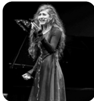
Zum Saisonauftakt im gmeiner huus winken Geschichten, Musik, eine Ausstellung...