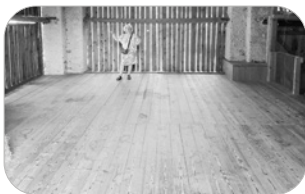
In der Tenne in der Dorfstraße 26 wird der Flohmarkt aufgebaut.

Am Freitag, 20. und Samstag, 21. März gibt es in der Dorfstraße 26 Gelegenheit zum Stöbern. Der Erlös des Flohmarkts im „Tend“ kommt einem sozialen Zweck zugute.