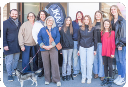
Re: Politisch Verantwortliche aus Ludesch und den Nachbargemeinden freuten sich mit den jungen Leuten über den neuen Jugendraum.