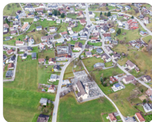
Sämtliche Wege im Ort sollen überprüft und bei Bedarf neu organisiert werden.