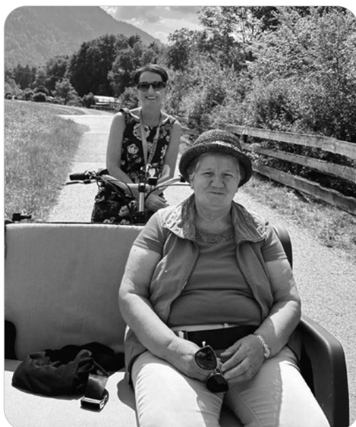
Eine Rikschafahrt macht Spaß.

Menschen mit Mobilitätseinschränkung können sich mit der Rikscha durch die Gegend kutschieren lassen. Die Gemeinde Ludesch hat so ein Gefährt angeschafft. Drei Piloten stehen an den Nachmittagen am Montag und Mittwoch für Ausfahrten ins Grüne – gerne auch mit Begleitung – bereit. Die Kosten werden von der Gemeinde Ludesch übernommen. Interessierte können sich unter 05550/2221-210 zur gemütlichen Rikscha-Fahrt anmelden.