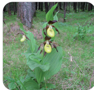
Das Europaschutzgebiet Ludescherberg beherbergt eine Vielzahl an seltenen Pflanzen.

Der Obst- und Gartenbauverein (OGV) lädt alle Interessierten am Freitag, 31. Mai dazu ein, die Wegränder und Blumenwiesen auf dem Ludescherberg zu erkunden.