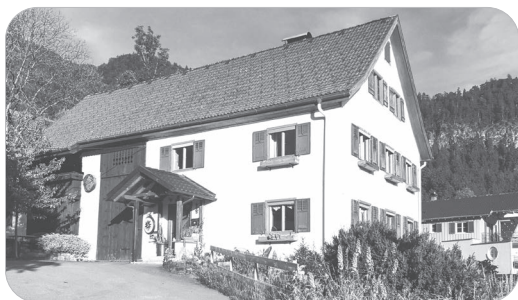
Das „Gmeiner Huus“ im Barx wurde zur Begegnungsstätte umgebaut.